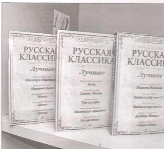
■ Фонд ПГБ г. Норильска пополнился новыми изданиями аудиокниг

Данная идея родилась не на пустом месте. Приступая к написанию заявки, специалисты провели анализ пользовательского спроса и изучили новые тенденции в работе с незрячими пользователями. Обратили внимание на то, что в библиотеку стали обращаться молодые ребята, имеющие проблемы со зрением, с просьбой устроить показ фильмов с тифлокомментариями (закадровым текстом, где описываются ключевые действия, происходящие на экране, а также внешний вид героев филь-